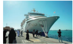
航空機派遣の事業参加費は約10万円。しかしこれらはほとんど、事前に実施される東京での研修費とOB組織「日本青年国際交流機構」への入会金だ。事業にかかる航空券代や滞在費はすべて税金でまかなわれる。世界青年の船は約22万円、東南アジア青年の船は約30万円。両方とも制費代込みで長。派遣期間が40〜50日間と長く、一人当たり約300万円は国から補助されているとのことなので、決して高いとはいえない。ちなみに、航空機派遣事業も一人あたり約200万円補助されているとのこと。

内閣府では、様々な青年国際交流事業を行っている。多国籍交流を通じて、青年相互の理解と友好を促進し、青年の国際的視野を広め、国際協調の精神を養うことがその目的だ。 S-cubeでは実際にこれらの事業に参加した学生の皆さんを話し手として、情報交換会「そこが知りたい!」内閣府青年国際交流事業」を11月16日、TC12110にて実施した。その内容をかいつまんでご紹介しよう。