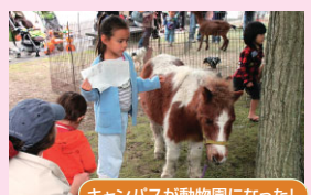
キャンパスが動物園になった!

2日目はゲルの横に移動動物園が出現。ウサギや亀などのかわいい動物から、ニシキヘビなどの爬虫類まで種類は様々。ニシキヘビに触れる体験コーナーは長蛇の列となった。また、ポニーも登場し、移動式住居のゲルと相まってまるでモンゴルにいるような気分。地域の子どもも普段見る事の出来ない動物達に大喜び。ヘビに触った学生からは悲鳴も上がったが、最後にポニーと写真撮影するなど学生も大いに移動動物園を楽しんでいた。