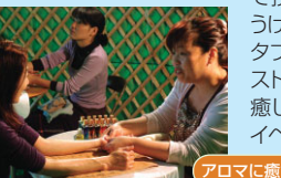
アロマに癒される...

プロのセラピストによるカラーセラピーや、アロマオイルを使ったハンドマッサージも大人気。予約枠があつという間に埋まってしまった。玄関に「新島」の表札を掲げたゲルでは、新島襄とその妻、八重による紙芝居が、クイズに正解すると景品がもらえるという、繰り返して参加する子供の姿も見られた。