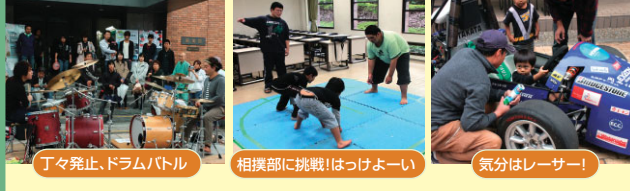
丁々発止、ドラムバトル