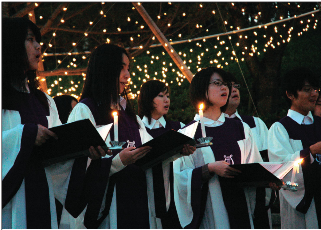
Merry Christmas! 「あめにはさかえ」「いざうたえ」...。170名ほどの参加者が見守る中、澄んだ歌声を響かせるのは学生聖歌隊。12月1日のクリスマスツリー点灯式にて。

12月1日夕刻、毎年恒例のクリスマスツリー点灯式が行われ、同時にS-cubeの副業館ハウスイルミネーションも点灯された。 0名が集まった。参加者にはお馴染みの同志社マーク入り竹製キャンドルホルダーが配布され、穏やかな灯りが周囲に広がった。 白いローブをまとった学生聖歌隊が「Dostoyevskiy College Song」、賛美歌「あめにはさかえ」を斉唱 した後は、キリスト教文化センター・原誠先生による聖書の一節「ルカによる福音書2章8・14」朗読と折り。原先生はこの中で、現在の政治、経済、軍事に翻弄され苦しんでいる人々や人間関係に疲れ自殺に至る人々などが存在することに