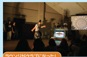
ラウンジがクラブになった!

1日目の夕方、いつもは憩いの場として開放されているラウンジ棟がダンス会場に!BMXと呼ばれる自転車を使った激しいパフォーマンスやダンスサークルのSoul2Soulによるストリートダンスが繰り広げられた。最後は、Tanzmusikの作り上げるクラブミュージックに会場に詰めかけた参加者は体を揺らした。