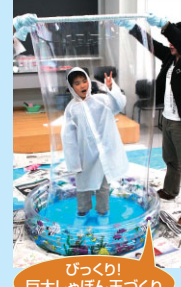
びっくり! 巨大シャボン玉づくり

ハローホールには巨大迷路が出現!複雑に入り組んだ通路を歩み、見事ゴールするとささやかな景品がもらえるのだ。早い人なら5分ほどでクリアする迷路も、いったん迷うと20分はかかってしまう。この難しさがクセになって、10回通い詰めたツワモノや(覚えてしまわないのか疑問?)、自らにタイムトライアルを課す人も。子供から大人まで夢中になって、なんと2700人余り!「面白かった!」と大評判だった。