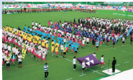
緊張感みなぎる入場行進

5月の爽やかな薫風の下、体育祭が行われた。香里生全員のフレッシュなエネルギーが、人工芝の第一グラウンドいっぱいに弾けた一日であった。