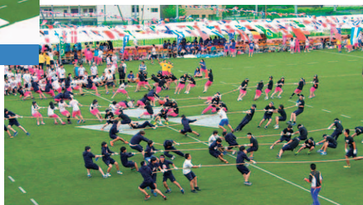
新種目の「網取り」合戦 負けじと網を取り合う様子