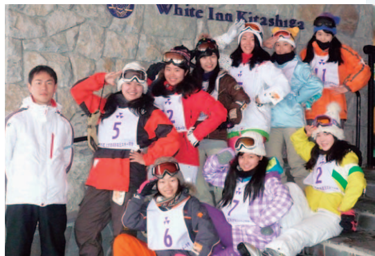
班ごとの集合写真