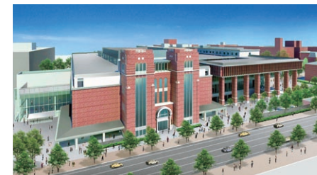
中学校跡地に計画を進める「今出川キャンパス新棟(仮称)」手前は烏丸通