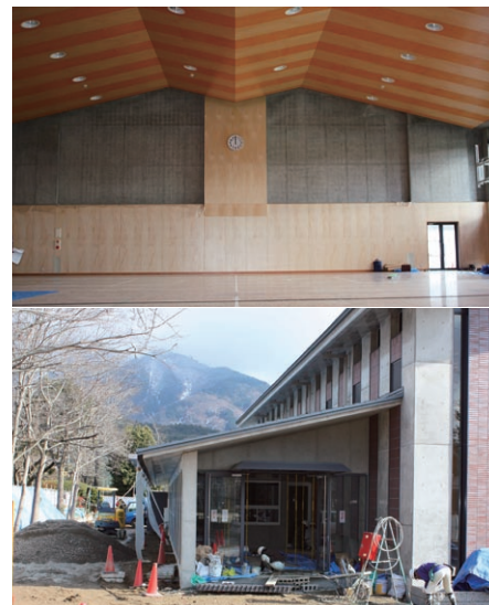
完成が近づく吉峰館。小学校屋内運動施設および標本資料施設として建設を進めてきた。