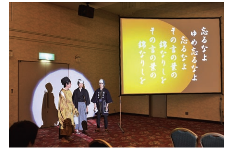
北海道函館水産高等学校の生徒による寸劇