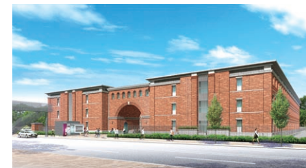
「京都市産業技術研究所繊維技術センター」跡地に計画を進める「烏丸キャンパス」