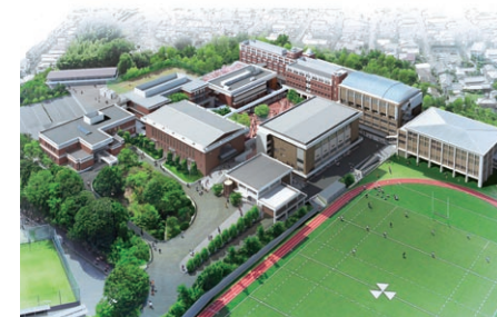
計画を進める普通教室棟、特別教室棟