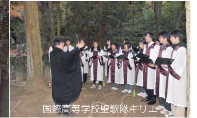
国際高等学校聖歌隊キリエ