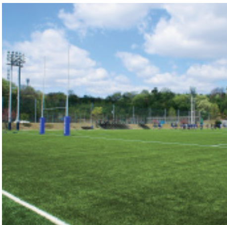
人工芝が敷き詰められたラグビー場 (大学京田辺校地)

サッカー場とアメリカンフットボール場の人工芝敷設 および硬式野球場の夜間照明設置は2006年度に完了し、 スポーツ健康科学部の教育・研究を支える施設は計画のもとに着実な整備を重ねている。