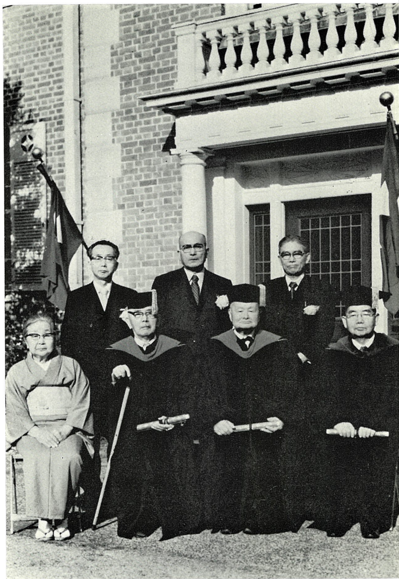
同志社大学名誉学位を贈与された諸氏（本文52頁参照）