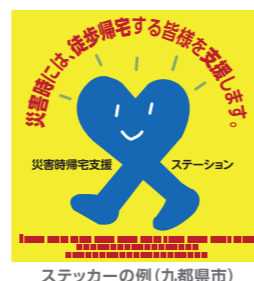
ステッカーの例(九都県市)