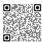
(※1) 全学共通教養教育 センターホームページ

(※4) 既習の初修外国語の登録を希望する1年次生の面談、登録資格を有しない初修外国語、及びこれまで認定・飛び級した初修外国語の登録を引き続き希望する学生の面談を実施。