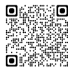
(※2) 国際課ホームページ